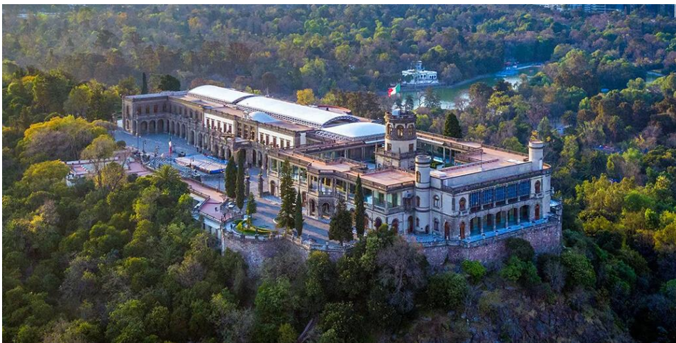
CHÂTEAU DE CHAPULTEPEC

Le Château de Chapultepec resplendissait merveilleusement avec ses milliers de petites lumières. Les avenues et l'escalier central étaient déserts, et les portes hermétiquement closes. Il est difficile d'entrer au milieu de la nuit dans le bois de Chapultepec, parce que les gardiens et les gendarmes surveillent les lieux avec vigilance, et si quelque étudiant gnostique Rose-Croix avait osé s'aventurer dans le bois, il aurait risqué d'être pris pour un vulgaire voleur.