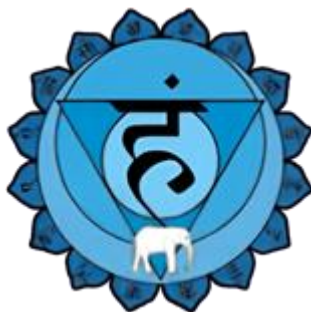
VISHUDDHA Église de Sardes

Le développement complet de ce centre Akashique nous permet de conserver notre corps vivant même durant les nuits profondes du Mahapralaya (la grande Dissolution cosmique). L'incarnation du Grand Verbe est impossible tant que le Serpent sacré n'a pas été éveillé. L'agent du Verbe est, précisément, l'Akasha. L'Akasha est au Verbe ce que les fils conducteurs sont à l'électricité. Le Verbe a besoin de l'Akasha pour sa manifestation.