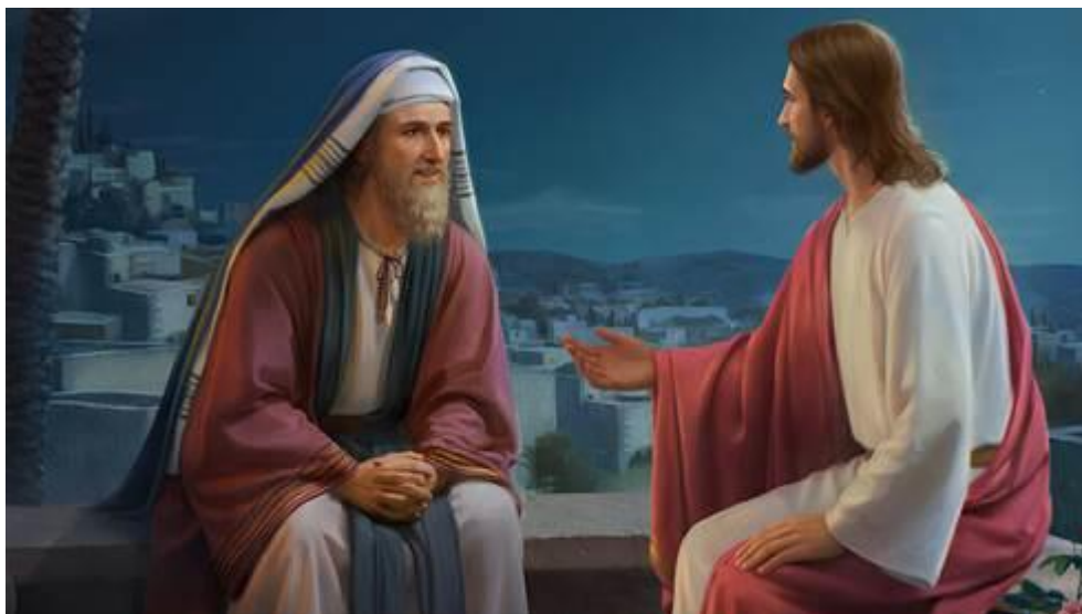
NICODÈME et JÉSUS

Il y a des gens qui veulent séparer le Verbe Divin de la Magie Sexuelle. Cela est absurde. Personne ne peut incarner le Verbe s'il exclue la Magie Sexuelle. Jésus, qui est l'incarnation même du Verbe, Jésus qui est le Verbe lui-même fait chair, a enseigné la Magie Sexuelle, dans l'Évangile de saint Jean, précisément. Il est nécessaire d'étudier l'Évangile de saint Jean. Voyons, entre autres passages, l'entretien avec Nicodème, chapitre III, versets 1 à 21 :