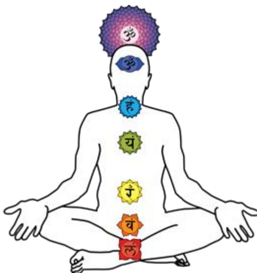
LES SEPT CHAKRAS PRINCIPAUX

Les sept glandes les plus importantes de l'organisme humain constituent les sept laboratoires contrôlés par la loi du triangle. Chacune de ces glandes a sa correspondance dans un chakra de l'organisme. Les sept chakras entretiennent une étroite corrélation avec les sept Églises de la moelle épinière, dans lesquelles ils prennent racine. Les sept Églises de l'épine dorsale contrôlent les sept chakras du système nerveux grand-sympathique.