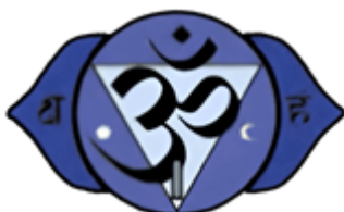
AJNA Église de Philadelphie

Lorsque la Kundalini arrive à la hauteur de l'espace entre les sourcils, l' Église de Philadelphie s'ouvre. Celle-ci est l'œil de la Sagesse. Le "Père qui est en secret" demeure dans ce centre magnétique. Le chakra de l'entre-sourcils a deux pétales fondamentaux et un grand nombre de radiations resplendissantes. Ce centre est le trône du mental. C'est le centre de la clairvoyance. Aucun véritable clairvoyant ne dit qu'il est clairvoyant. Aucun véritable clairvoyant ne dit : "J'ai vu." Le clairvoyant initié dit : "Nous avons pensé que... ; nous estimons que..."