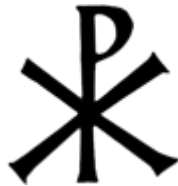
SYMBOLE DU CHRISME Lettres X (Chi) et P (Rhô)

L'Adorable Dieu Christus (ou Crestos ) vient des cultes archaïques du Dieu-Feu. Les lettres P (du latin pyra , bûché) et X (la Croix) forment, ensemble, le hiéroglyphe de la production du Feu Sacré.