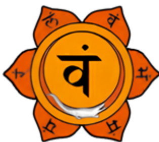
SVADHISTHANA Église de Smyrne

L'ascension de la Kundalini dans la région de la prostate met en activité les six pétales de l' Église de Smyrne . Cette Église nous confère le pouvoir de dominer les Eaux Élémentales de la vie et le bonheur de créer.