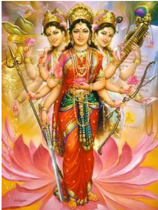
SARASVATI, LAKSHMI, et PARVATI

Les Saintes Écritures de l'Inde affirment que le nombril , le cœur et la gorge sont des centres ignés de l'organisme humain, et elles ajoutent qu'en méditant sur ces centres nous rencontrons les Déeses Sarasvati, Lakshmi et Panati ou Gauri (ou Jagadgauri), dans l'ordre hiérarchique successif.