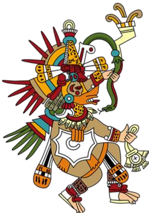
QUETZALCÓATL Codex Borgia

Le Serpent à Plumes est, pour parler clairement, l'Oiseau-Serpent. Le Serpent à Plumes était identifié avec Quetzalcóatl , le Christ Mexicain. Quetzalcóatl est toujours accompagné des symboles divins de l'Aigle et du Serpent. Le Serpent à Plumes, cela dit tout. L'Aigle de l'Esprit et le Serpent de Feu nous convertissent en Dieux.