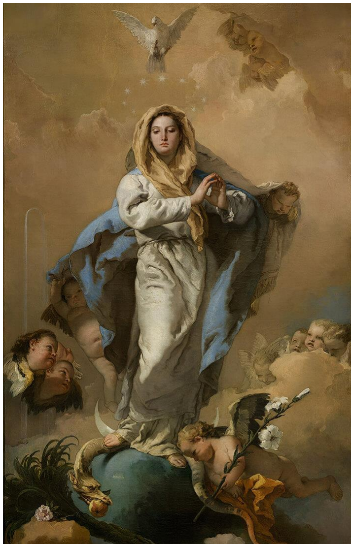
L'IMMACULÉE CONCEPTION - Giovanni Battista Tiepolo

Tout le Karma des mauvaises actions, des réincarnations passées, peut être pardonné par la Mère Divine. Lorsque le repentir est absolu, le châtiment s'avère superflu.