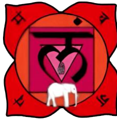
MULADHARA Église d'Éphèse

La Kundalini est l'énergie primordiale enfermée dans l'Église d'Éphèse. Cette Église de l'Apocalypse est un centre magnétique situé entre l'anus et les organes génitaux.