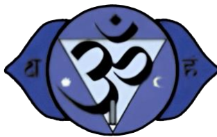
AJNA Église de Philadelphie

Lorsque la Kundalini parvient à la hauteur de l'espace entre les sourcils, alors s'ouvre l'Église de Philadelphie. C'est l'Œil de la Sagesse. Dans ce centre magnétique demeure le Père. Le chakra de l'entre-sourcils a deux pétales et est le trône du mental. Lorsque le mental-matière se transforme en Mental-Christ, nous recevons le manteau des Bouddhas et l'Œil de Shiva. Quiconque éveille le chakra frontal devient clairvoyant.