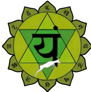
ANAHATA Église de Thyatire

Lorsque la Kundalini parvient à la hauteur du cœur, alors s'ouvre l'Église de Thyatire ; le pouvoir d'agir sur les quatre vents nous est conféré. Le lotus du cœur a douze pétales et son élément est l'Air élémental des sages. Quiconque veut apprendre à s'introduire avec son corps physique à l'intérieur des mondes suprasensibles, doit éveiller le chakra du cœur. C'est ce que l'on connaît sous le nom de science Jinas : le corps humain peut s'échapper du plan physique et entrer dans les mondes suprasensibles.