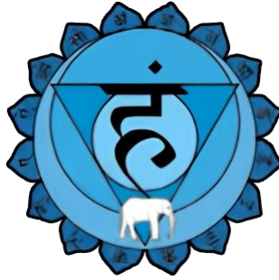
VISHUDDHA Église de Sardes

Lorsque la Kundalini parvient à la hauteur de l'espace entre les sourcils, alors s'ouvre l'Église de Philadelphie. C'est l'Œil de la Sagesse. Dans ce centre magnétique demeure le Père. Le chakra de l'entre-sourcils a deux pétales et est le trône du mental. Lorsque le mental-matière se transforme en Mental-Christ, nous recevons le manteau des Bouddhas et l'Œil de Shiva. Quiconque éveille le chakra frontal devient clairvoyant.