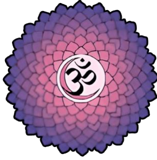
SAHASRARA Église de Laodicée

Dans l'Église d'Éphèse nous conquérons la terre ; dans l'Église de Smyrne, l'eau ; dans l'Église de Pergame, le feu ; dans l'Église de Thyatire, l'air ; dans l'Église de Sardes, le fluide akashique ; dans l'Église de Philadelphie nous conquérons l'Esprit, et dans l'Église de Laodicée nous conquérons la Lumière. C'est ainsi que nous devenons Rois et Prêtres de la nature, selon l'ordre de Melchisédech.