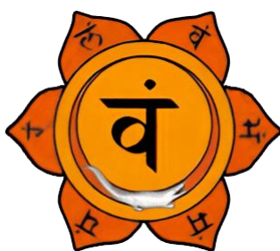
SVADHISTHANA Église de Smyrne

Lorsque le Serpent arrive à la hauteur de la prostate, l'Église de Smyrne s'ouvre. Ce chakra a six pétales. Le chakra prostatique nous confère le pouvoir de créer. Toute création serait impossible sans le chakra prostatique. L'immortel Babaji, le Christ-Yogi de l'Inde, dont le corps est âgé de plusieurs millions d'années qui se perdent dans la nuit des siècles, est le suprême recteur du chakra prostatique. Babaji dirige toute vie et a le pouvoir de créer et recréer à volonté. L'Eau élémentale des sages ( l'Ens Seminis ) est l'élément de ce chakra. Quiconque ouvre l'Église de Smyrne a le pouvoir sur les eaux et les tempêtes.