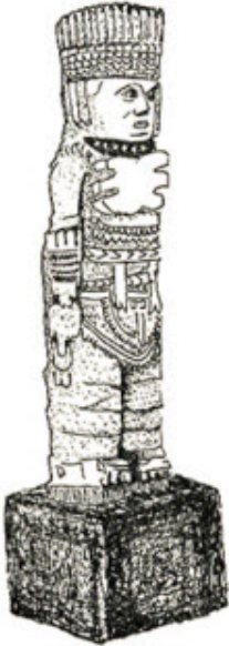
REY SOLAR AZTECA

Dans les anciennes Écoles des Mystères aztèques, après les épreuves auxquelles étaient soumis les candidats, ceux-ci pouvaient se mettre à travailler directement avec le Serpent à plumes. Nous ne voulons pas dire par là que vous avez passé victorieusement vos épreuves ; ceci, nous le verrons plus tard. En attendant, nous allons continuer à travailler par la méditation.