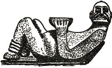
CHAC - MOOL

Dans le Musée d'Anthropologie et d'Histoire de la ville de Mexico il existe la statue d'un homme en pierre, à demi-couché, en décubitus dorsal. Les plantes des pieds sont posées sur le lit, les genoux vers le haut, les jambes à demi fléchies sur les cuisses, le torse arqué dans l'attitude de la première impulsion pour se lever, le visage vers la gauche et le regard à l'horizon ; dans ses mains, un récipient à hauteur du plexus solaire.