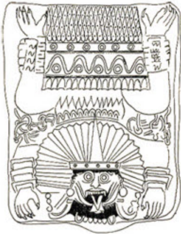
QUETZACOATL - HARPOCRATICO

Les Djinns, les êtres, les peuples ou les choses que le voile de la quatrième dimension occulte à notre vue. Dans le chapitre 3 nous parlons des quatre corps de péché ; ceux-ci servent à la manifestation de l'homme dans le monde physique. Le corps physique est le seul que connaissent les profanes, méconnaissant l'éthérique, l'astral et le mental. Le corps physique peut se mouvoir dans