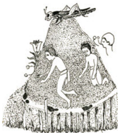
EL CERRO DE CHAPULTEPEC

Chapultepec vient de deux racines aztèques : Chapul et Tepec.